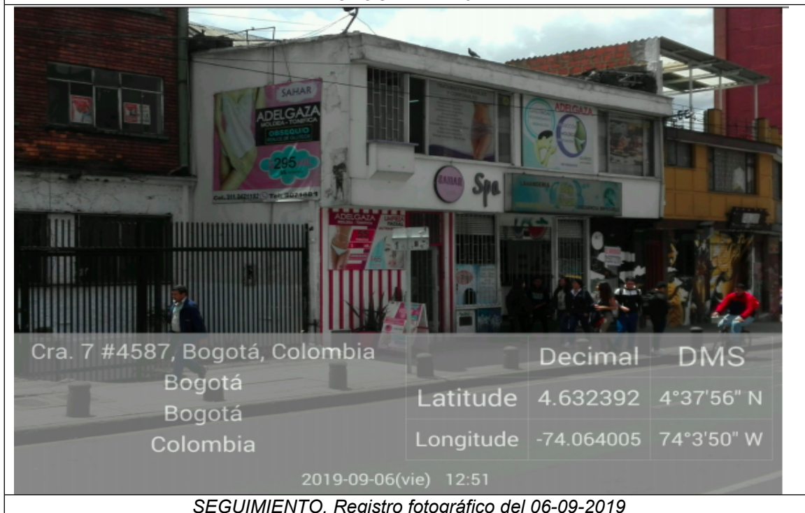
SEGUIMIENTO. Registro fotográfico del 06-09-2019